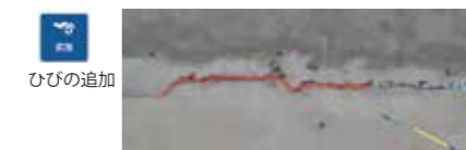
ひびの追加 構成点をトレースしながらひびを追加

自動解析したひびの編集も行えます。追加、削除、結合、ストレッチによるひびの変更等、スティッチされた写真を背景に CAD 感覚で編集作業が行えます。