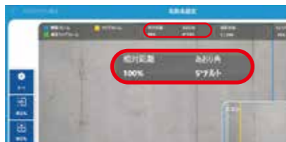
1枚目の写真を基準に相対距離、あおり角をガイド

均一な写真を撮影するため対象面に対して同じ距離、同じ角度で撮影するのが理想です。SightFusion では、1 枚目に撮影した写真を基準に相対距離と対象面へのあおり角を常にガイドしますので、相対距離は ±10%、あおり角は ±30° までの範囲で撮影すれば、ひび割れ撮影に適した写真が取得できます。