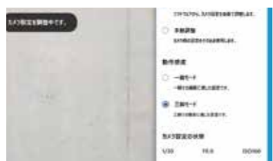
周りの明るさや環境に応じてソフト側でカメラの設定をコントロール

カメラの設定値 (ISO感度、シャッタースピード、絞り値) はソフトで自動調整 カメラの知識が無い方でも安心してご使用いただけるよう、ソフトウェア側で周りの環境に応じて、自動的にISO感度、シャッタースピード、絞り値を調整し撮影することができます。ひび割れ計測に最適な条件をソフトウェアでコントロールしますので、撮影時のミスを軽減します。