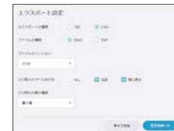
ひびの形状はCADデータとして出力。リストもCSV形式で出力。

編集したひびのデータは CAD データとして (DWG・DXF) 出力することが可能です。背景画像付きで出力されますので、お持ちの CAD システムにて最終の成果にまとめることができます。合わせてひびリストは CSV でも出力されますので、帳票への利用が可能です。