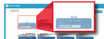
データがクラウドにアップロードされると自動でスティッチ処理を開始

撮影したプロジェクトは専用クラウドにアップが完了すると、クラウド上で弊社独自の技術により高精度スティッチを開始します。クラウド上での処理のため、PC で他の作業をしていても負荷はかかりません。