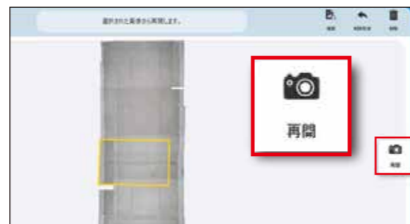
再撮影したい場所の隣接フレームを選択し再開することで、自己位置から再撮影場所を見つけやすくなります。直後に再撮影を行えることで、現場戻り作業（再撮影）が大幅に軽減されます。