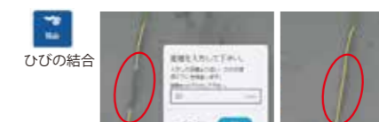
ひびの結合 指定した2点間が入る距離を入力し端点を結合