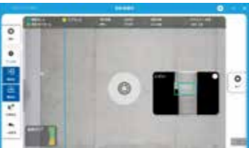
最適なラップ率でシャッターボタンを表示

隣接する画像に対して最適なラップ率（40% 以上）になった時点で黄枠 ⇒ 緑枠に変化しますので、作業者はタブレット上の自己位置を確認しながら作業が行えます。撮影が可能になるとシャッターボタンを表示します。オート撮影、マニュアル撮影をご用意していますので、状況に応じて切り替えることができます。