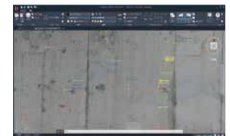
出力データをDWG TrueView※で確認 背景画像付きで出力されている ※Autodesk inc. 社製品