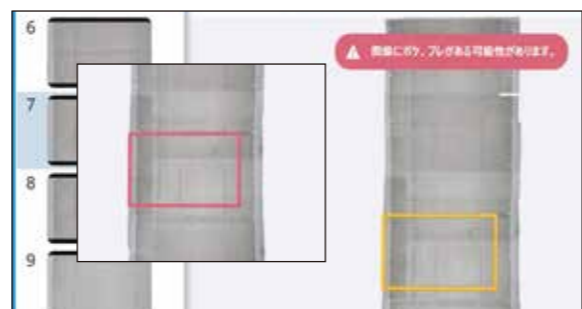
ピンボケやブレがある写真は赤い枠で表示します。内容を確認後削除しその部分の再撮影がすぐに行えます。

撮影した画像はプロジェクト単位で管理されます。ピンボケやブレがあり、ひび検出に不適切な画像は赤枠で表示しますので、その場で確認し削除が可能です。画像を削除した箇所を再撮影することでその場で補完できますので、後日、現場へ戻っての再撮影は軽減されます。